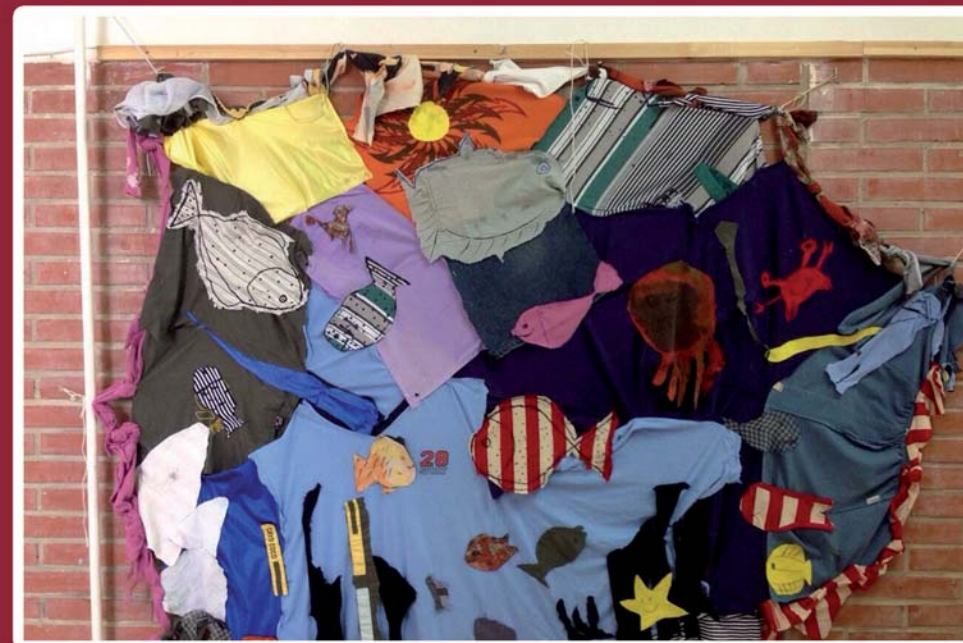
Imagen: "La Mar de Emociones" Obra realizada por los alumnos de 4º de Primaria del CEIP Maspalomas. San Pedro del Pinatar.